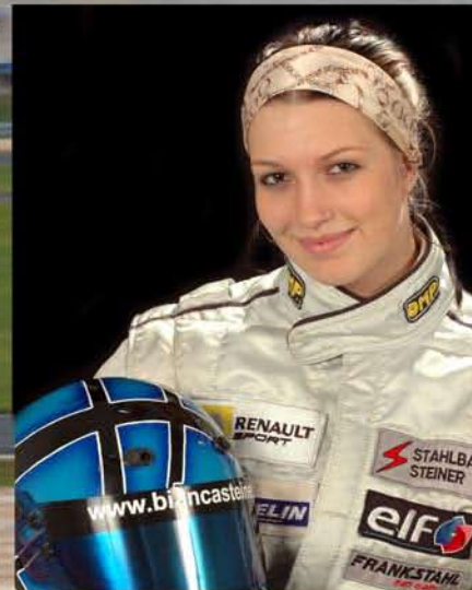
Formula RENAULT 2000